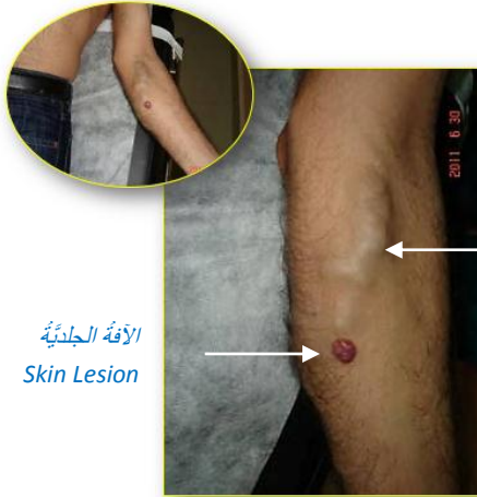
الأفة الجلديّة Skin Lesion

حاليّاً، نجد برعماً لحميّاً ورميّ الشّكل على الوجه الأماميّ للتّلت العلويّ من السّاعد الأيسر. التورّم غير مؤلم، جافّ، أحمر اللون، بقيس (1 X 0,5) سم تقريباً. لا يوجد احمرارٌ في محيط الأفة الجلديّة. كما لا نجد سخونة موضعيّة أو جهازيّة. الحالة العامّة جيّدة. بالمقابل، نجد توسّعاً وتعرّجاً في الأوردّة السّطحيّة انطلاقاً من الورم وبالأتجاه الدّاني. الأوردّة المتخنّرة تشكّل مع محتواها الخثريّ كتلةً، 3 X 10 سم، مرنة، غير مؤلمة، غير ملتصقة بما حولها أو بالجلد. التّشكيل الوريديّ تلا التّشكيل الجلديّ بفاصل شهور قليلة. كما نجد تشكيلين عقديين على الوجه الأنسي للعضد الأيسر. العقدة الأقرب إلى المركز مؤلمة قليلاً. تجسّ بعض العقد اللمفيّة المتضخّمة في الإبط الأيسر.