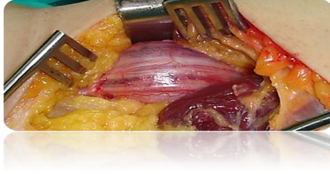
الشكل (٢) مشاهدة جراحية Per- Operative View

يسكن الورم مادة العصب الطَّنوبوي، ويبدو محاطاً بالحزم العصبية من جهاته جميعاً.