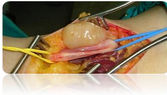
الشكل (٤) مشاهدة جراحية Per- Operative View

أمكن بسهولة عزل الورم عن مجاوراته النسيجية وعن الوريد المأبضي خصوصاً. يظهر الورم بشكله المغزلي وسطحه الناعم. كما يبدو جلياً العصب الطَّنوبوي بقطره الطبيعي عند قطبي المغزل. محور الورم طولاني يوافق اتجاه العصب الأم.